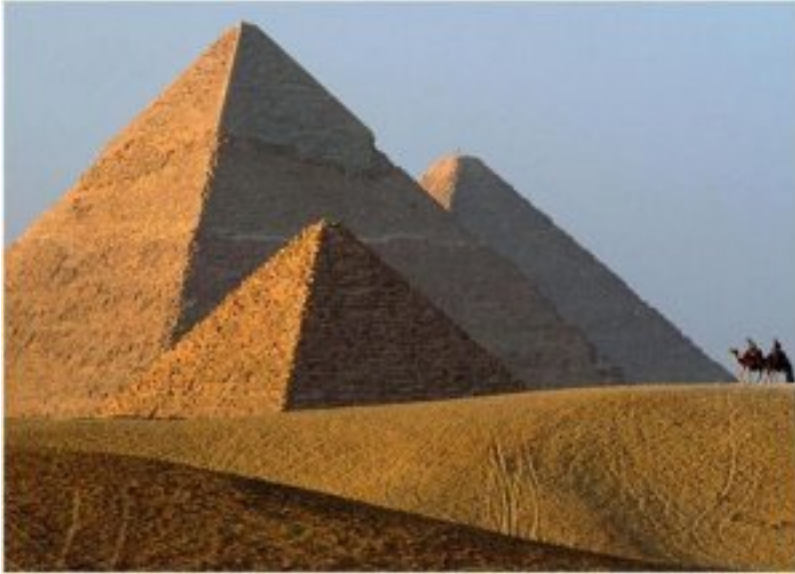
Gizos Piramidžių Trejybė

Nesmerk pasaulio, nes jis sukurtas Didžiosios Minties. Ne kūrinys kaltas, o mūsų samprotavimai apie jį. Aleksandrijos filosofai