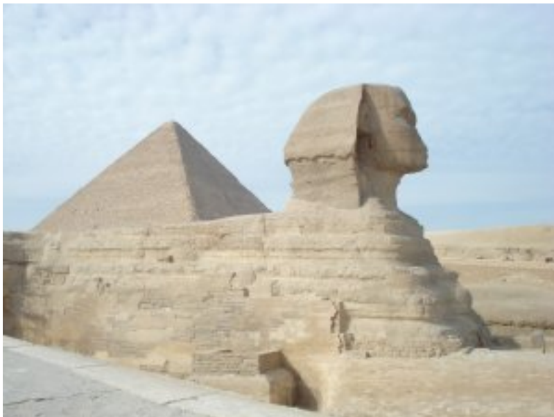
Sfinksas „Didžioji Tyla“.

Aš esu Didysis Vienis, Didžiojo Vienio sūnus; aš esu Ugnis, Ugnies sūnus.... Aš - Asaris, Amžinybės Viešpats. Asaris (Oziris), Egipto Išėjimo dienos šviesoje (Mirusių) knyga (XLIII,1,4)