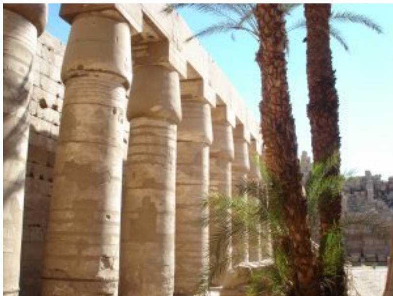
Karnako šventyklos kolonos. Tėbai

Egipto Išėjimo dienos šviesoje (Mirusiųjų) knyga