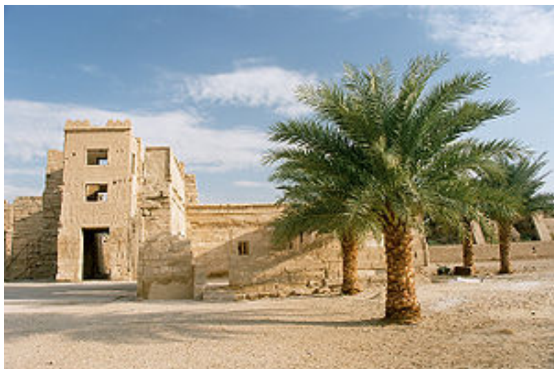
Ramisio (Ramzio) III šventykla, Medinet Habu

Būki pagarbintas tu, kuris pakyli virš horizonto Ra pavidalu, Tiesoje rymantis. Kai plauki Dangumi, visi veidai stebi tavo judėjimą, nors pats esi nematomas (amen arba amun) jų žvilgsniams. ... Nors tavo spinduliai nušviečia kiekvieną veidą, nesuvokiamas tavo auksinis švytėjimas. ... Pats vienas kuri savo raiškos pavidalą (sem), iškylantį virš pirmapradžių vandenų. ... Pirma savo kūrinių pasirodai Ra pavidalu, pakildamas virš horizonto. ... Esi spindulingu grožiu vainikuotas ir, būdamas nesukurtas, pats sukuri savo kūno narius, gimdamas Ra pavidalu, kildamas į padangę.