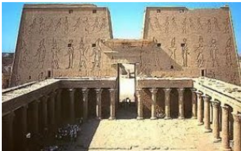
Edfu. Dievo Horo šventykla