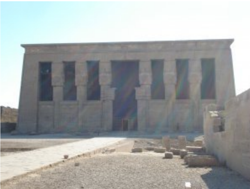
Hathoros šventykla Denderoje.

Nesmerk pasaulio, nes jis sukurtas Didžiosios Minties. Ne kūrinys kaltas, o mūsų samprotavimai apie jį. Aleksandrijos filosofai