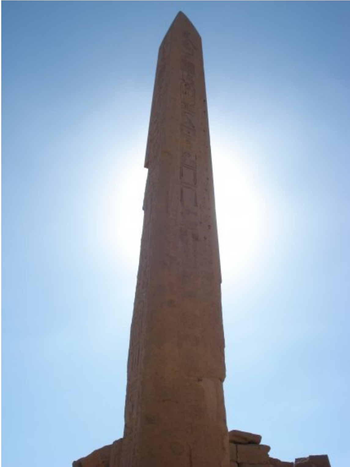
Pilonas Karnake. Tèbai.