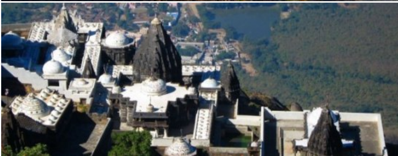
Girnar šventkalnis ir džainų bei hindu šventyklų kompleksas

Dvasinio reformatoriaus Ošo ašramą Punoje, kuriame praktikuojama 120 meditacijos formų.