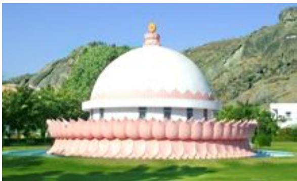
Brahma Kumaris šventykla