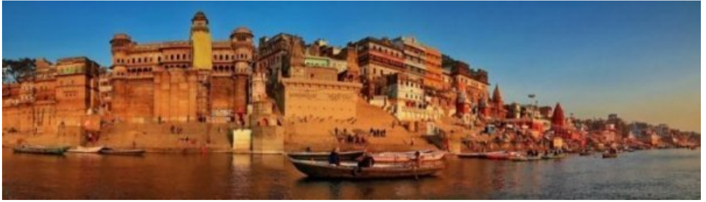
Varanasis, Gangos krantai